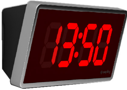
Yüzey Montaj Muhafazası