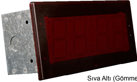
Sıva Altı (Gömme) Montaj Muhafazası