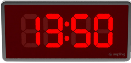
2,5 inç (6,35 cm)