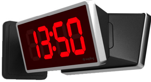
İkili Montaj Muhafazası